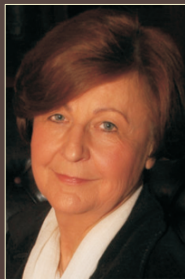
Fővédnök: Prof. Dr. Bagdy Emőke, pszichológus