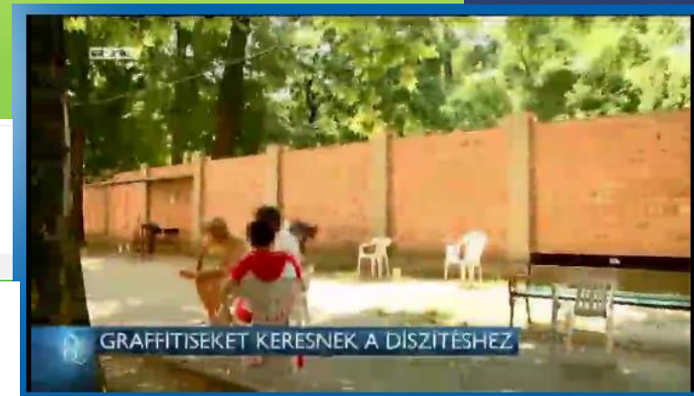
GRAFFITISEKET KERESNEK A DÍSZÍTÉSHEZ

Elsőprő sikert aratott a Nyírő Gyula Kórház addiktológiai osztályának új Facebook-oldalán egy múlt pénteki bejegyzés , amelyben arra kértek fel vállalkozó kedvű street artosokat, hogy fessék le az épület csupasz téglakerítését. A bejegyzés jelenleg tizenhatezer megosztás fölött jár, az RTL Klub is felkapta a témát, és közel hetven graffitis ajánlotta fel a segítségét.