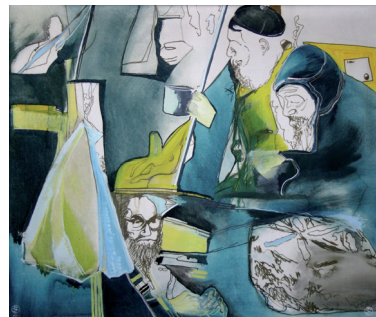
Gábor Áron, "Tétova remény" 1985, olaj, vászon, 112x122 cm