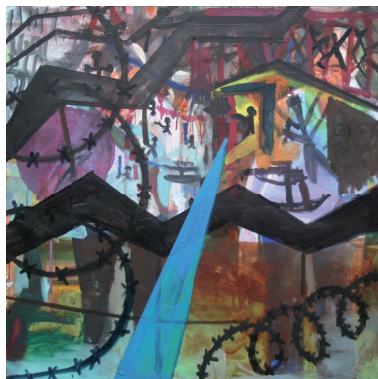
Holló István (cím nélkül) 2014, vegyes technika, 95x95 cm