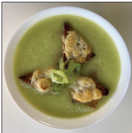
Francia hagymaleves (129. oldal)