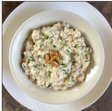
Diós tofukrém (128. oldal)