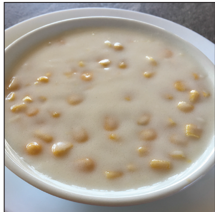
Tejszínes kukoricafőzelék (114. oldal)