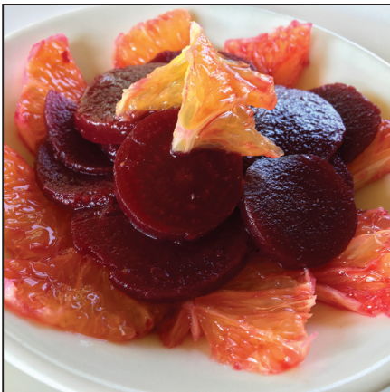
Narancsos céklasaláta (116. oldal)