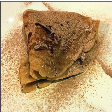
Almás palacsinta (125. oldal)