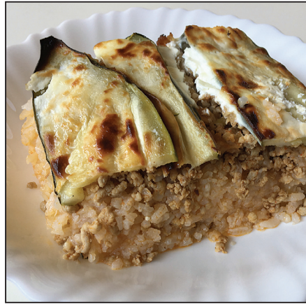
Rakott cukkini (105. oldal)