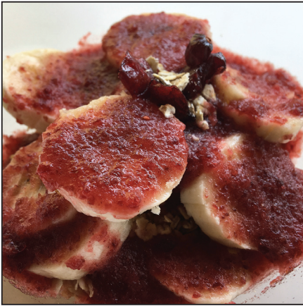
Áfonyás zabpelyhes banán (118. oldal)