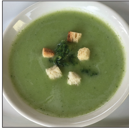
Brokkolipüré-leves kenyérkockával (119. oldal)