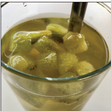
Kivikoktél (134. oldal)