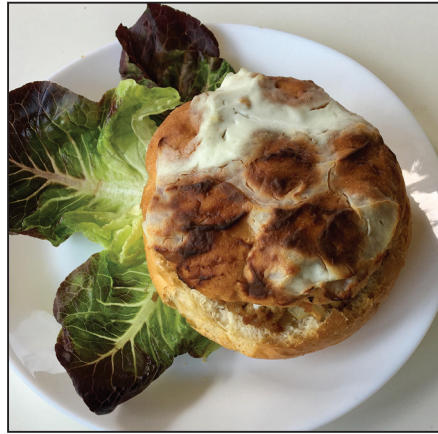
Gombával, hússal töltött zsemle (115. oldal)