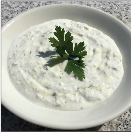
Kapros túrókrém (100. oldal)