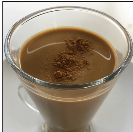
Tejeskávé fahéjjal (104. oldal)