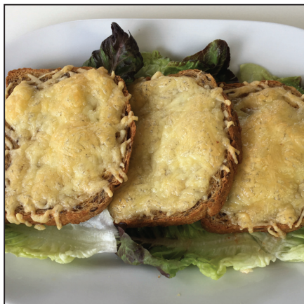
Sajtos pirítós (134. oldal)