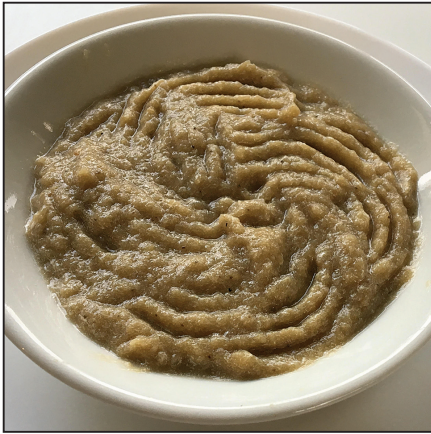
Padlizsánkrém (104. oldal)