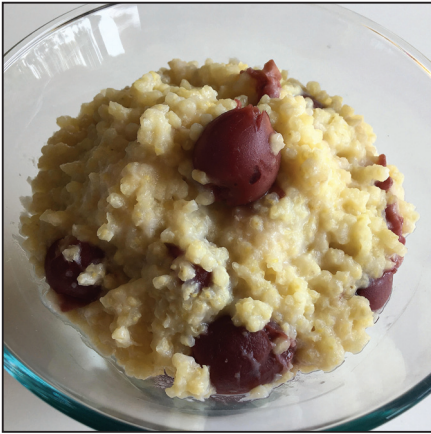
Köleskása (114. oldal)