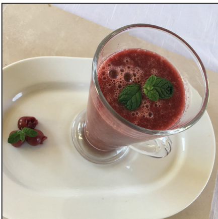
Vizes meggyturmix (132. oldal)