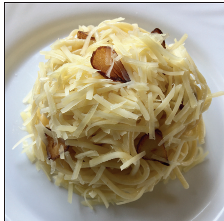
Fokhagymás tészta (106. oldal)