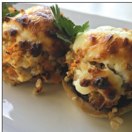
Túróval töltött gomba (136. oldal)