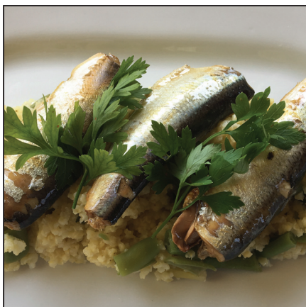
Zöldbabos-halas köles (132. oldal)