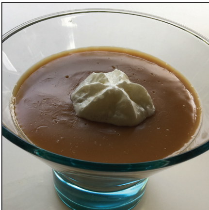
Karamellpuding (106. oldal)