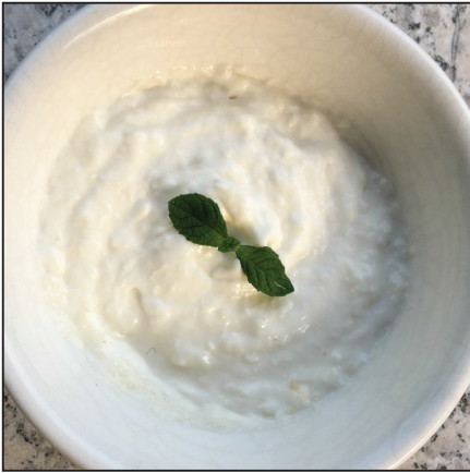
Tormás vajkrém (109. oldal)