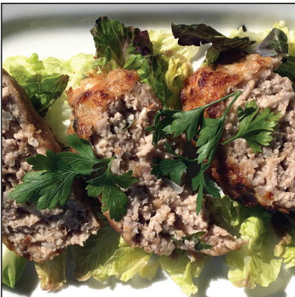
Vagdalt pogácsa (113. oldal)