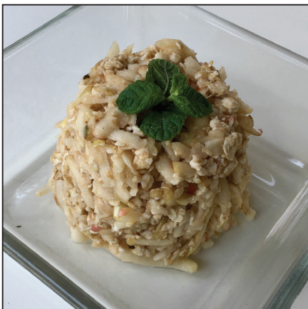
Zabpelyhes alma (128. oldal)