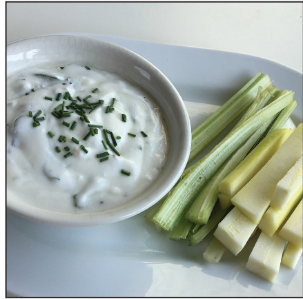
Zöldséges mártogatós (112. oldal)