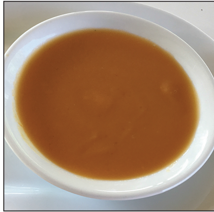
Sütőtökrémleves (100. oldal)