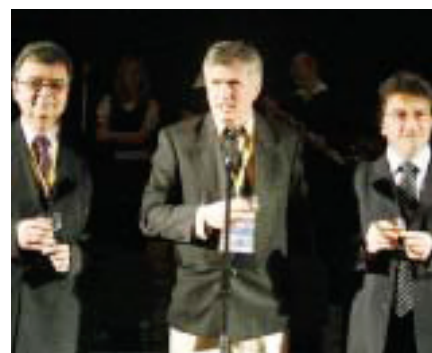
A Kongresszus elnöke, a Társaság elnöke és a Főtitkár köszöntik a bankett résztvevőit