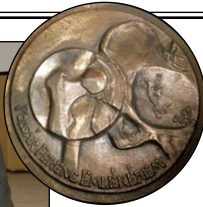
Polgár Ferenc díj

nősen izgalmassá tette, ahogy az előadók szintetizálták az orvosi és a gazdasági gondolkodásmódot, s ezzel kicsit felvázolták az osteoporosis jövőjét is a gyorsan változó ellátási rendszerekben. Bár az elmúlt években a MOOT már üdvözölhette kongresszusain az Egészségügyi Minisztérium egyes vezetőit, arra azonban most először kerülhetett sor, hogy konferenciánkon az OEP is csúcset vezetői szinten vett részt, sőt előadásban is kifejtette stratégiai elveit és ellátási szempontjait. Az IOF-MOOT közös szimpóziumát a kiemelkedően rangos nemzetközi és hazai részvétel, továbbá a legkorszerűbb témaválasztás és a sokszakmásk megközelítés az elmúlt évtized legfontosabb szakmai eseményévé tette a Társaság életében.