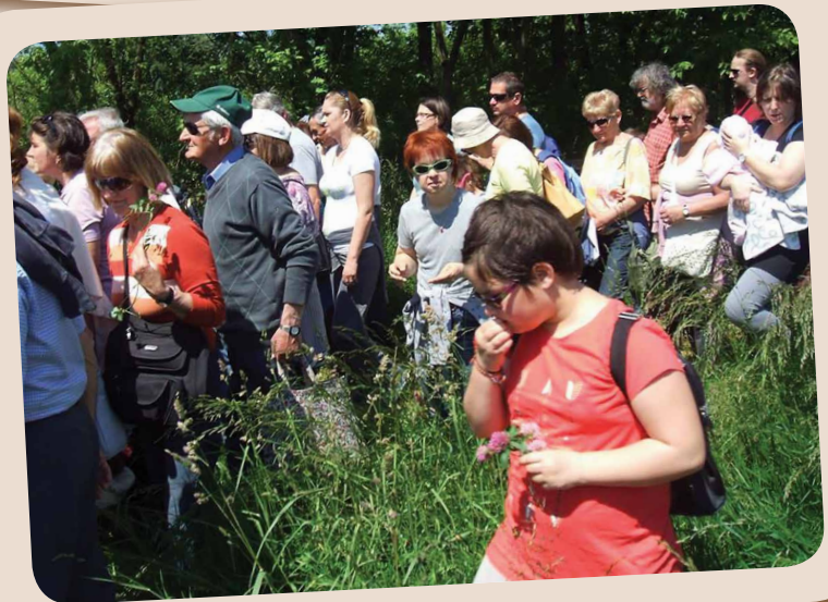
Kirándulás Alsónemesapátiba II.