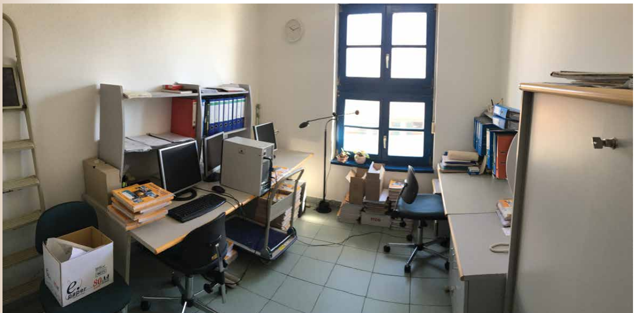
Az előadóterem, az alapítványi iroda és a Reumatológia Mindenkinek szerkesztőségi iroda