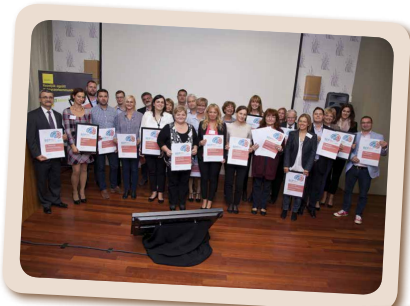
A Medical Tribune és a Kreatív Csoport által szervezett BetegEdukációs Projektek versenyének díjátadó ünnepsége.