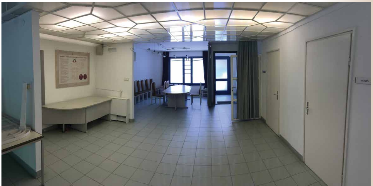
A földszinti előadótér és tanácskozó