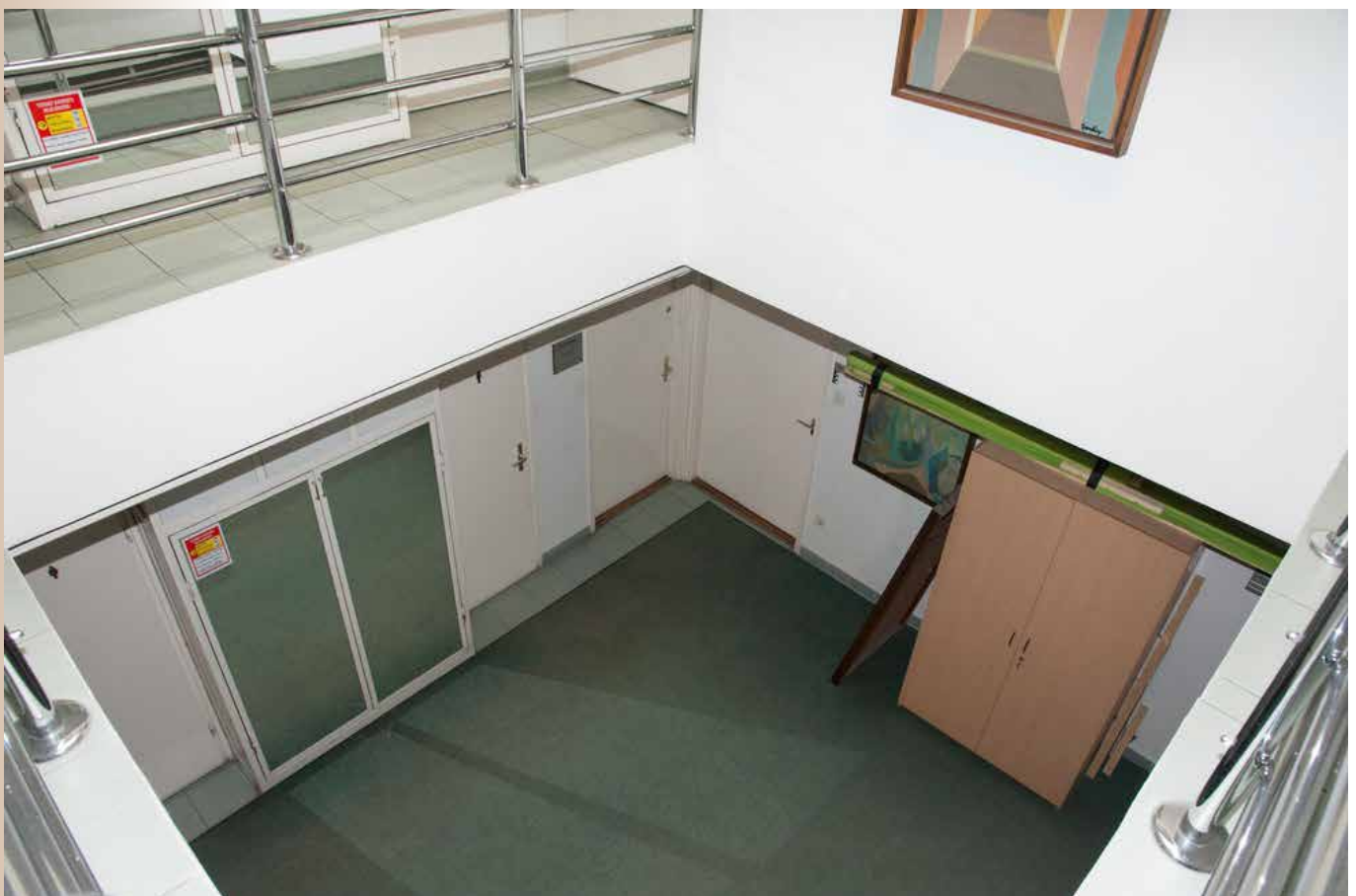
Az átrium, a felső szinten a Tudomány szerkesztősége, az alsó szinten a Magyar Reumatológusok Egyesülete irodái, a Magyar Reumatológia szerkesztősége és az Intellimed Kft. irodái