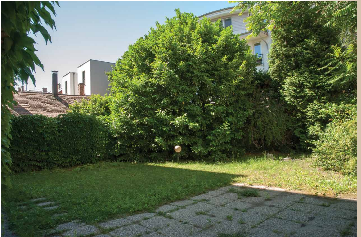
Kijárat az udvarra és a belső udvar