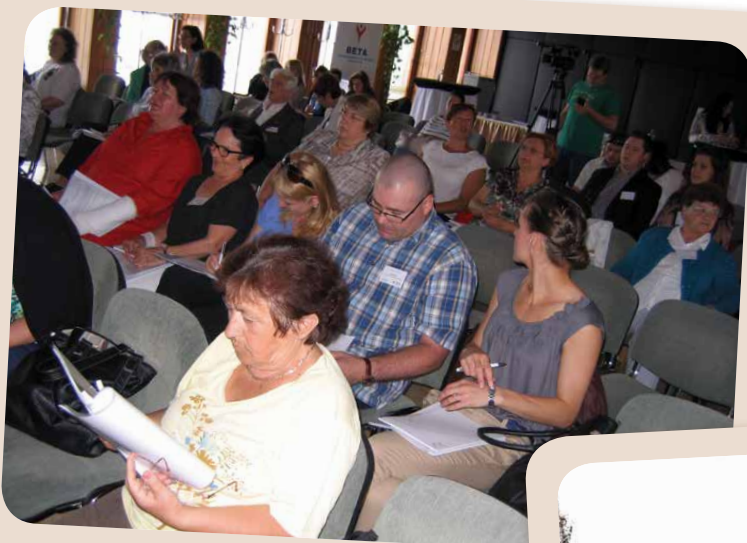
Az Alapítvány és a Reumabetegek a Célzott Terápiáért Egyesület (RECTE) képviselői az Innovatív Gyógyszergyártók Egyesülete (AIPM) által rendezett Betegszervezetek Akadémiáján.