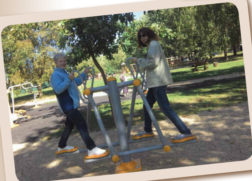
Kirándulás Sárvárra I.