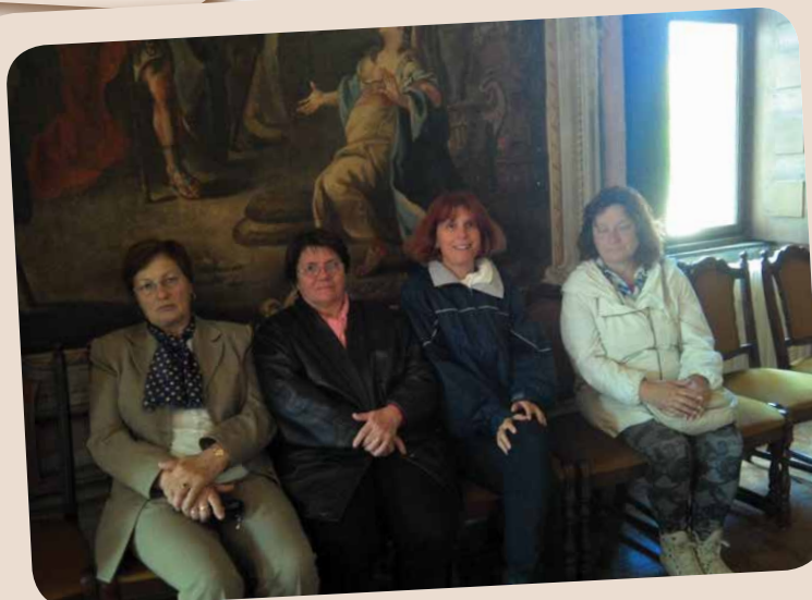
Kirándulás Sárvárra III.