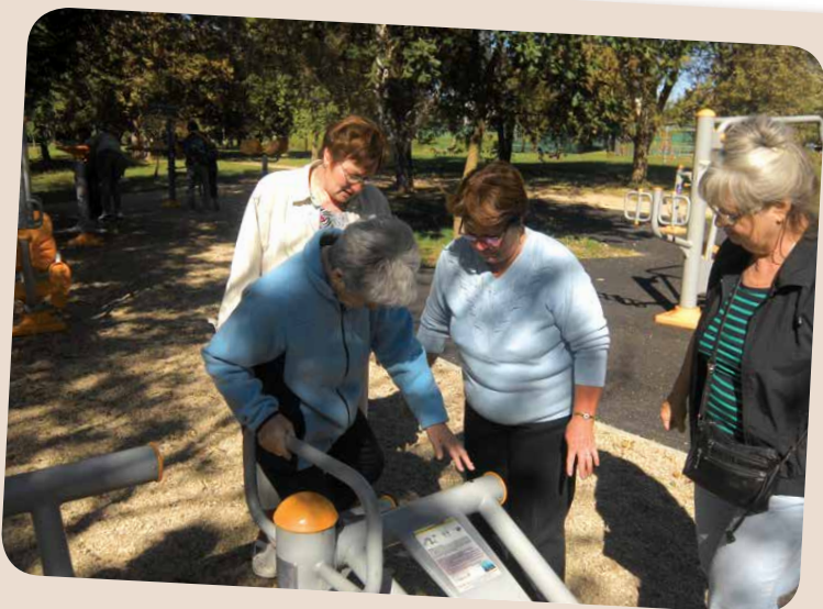
Kirándulás Sárvárra II.