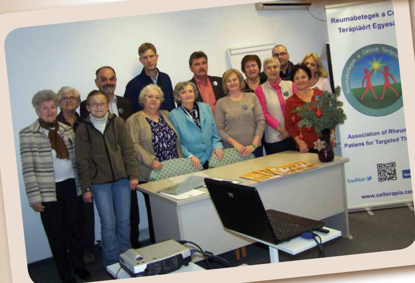
A RECTE budapesti taggyűlésén