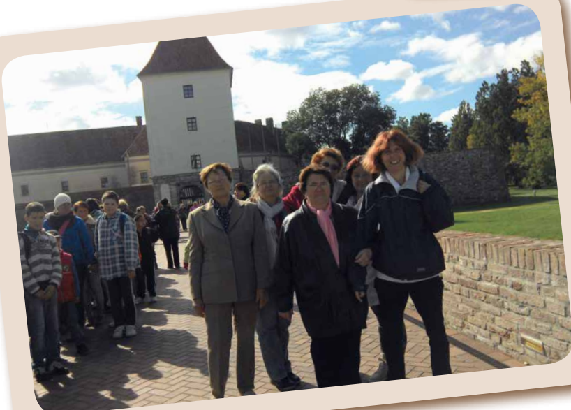
Kirándulás Sárvárra IV.