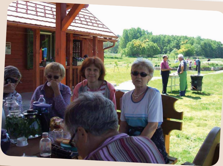
Kirándulás Alsónemesapátiba I.